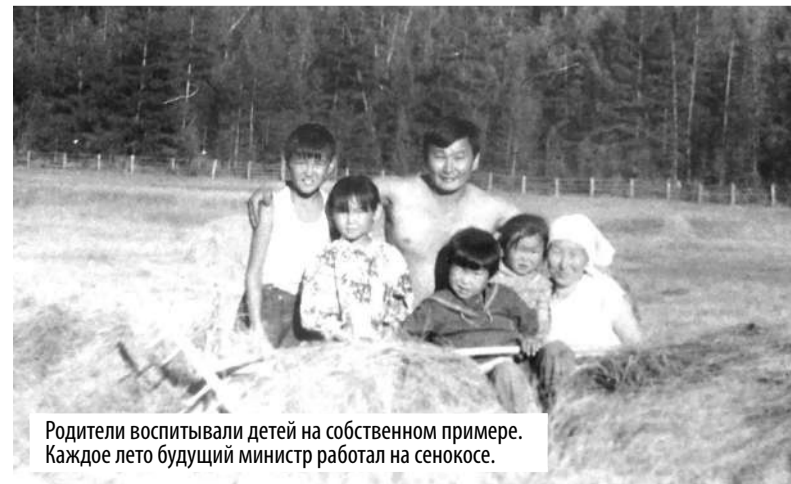
Родители воспитывали детей на собственном примере. Каждое лето будущий министр работал на сенокосе.