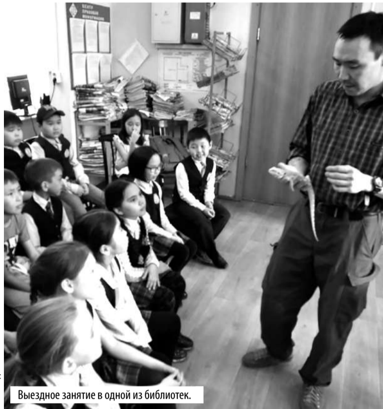
Выездное занятие в одной из библиотек.

ли корм. И некоторые из них не просто грызут, а буквально поглощают его. Ну, увидели и забыли. Большого значения не придали этому факту.