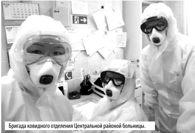
Бригада ковидного отделения Центральной районной больницы.