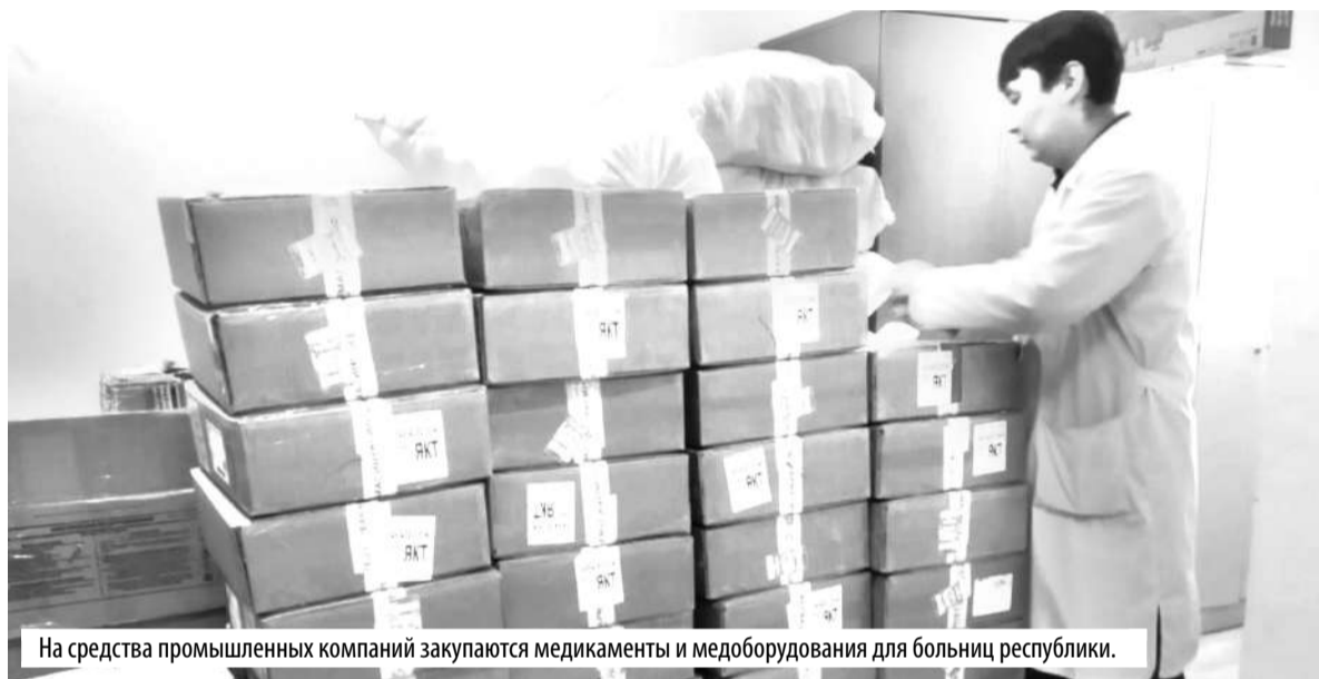
На средства промышленных компаний закупаются медикаменты и медоборудования для больниц республики.

На средства пожертвований от крупных компаний производятся закупка и установка медицинского оборудования в учреждения здравоохранения республики.