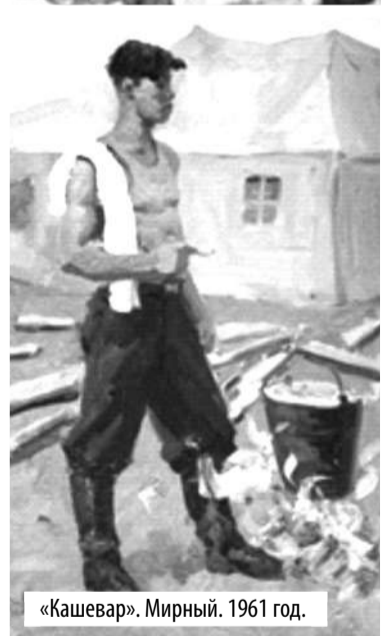
«Кашевар». Мирный. 1961 год.