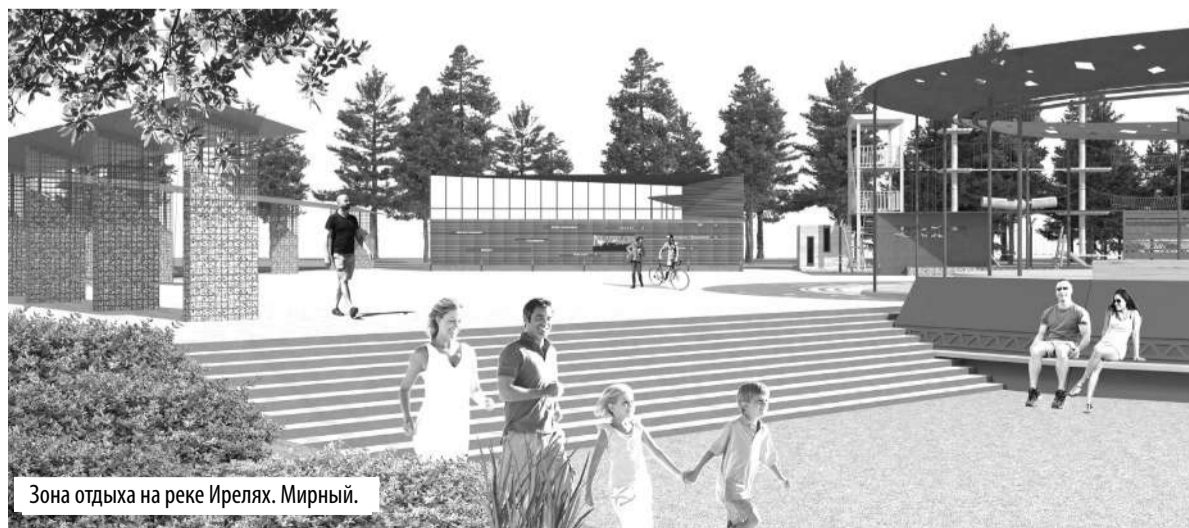
Зона отдыха на реке Ирелях. Мирный.

– В такие периоды, как сейчас, да и вообще в целом, возрастает необходимость парковых зон,