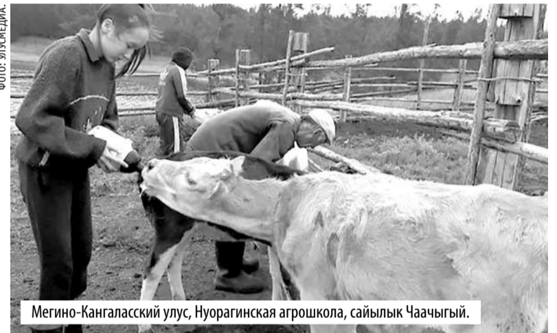
Мегино-Кангаласский улус, Нуорагинская агрошкола, сайылык Чаачыгый.

Развитие сайылычного хозяйства – для республики очень высокий приоритет. Наряду с тем