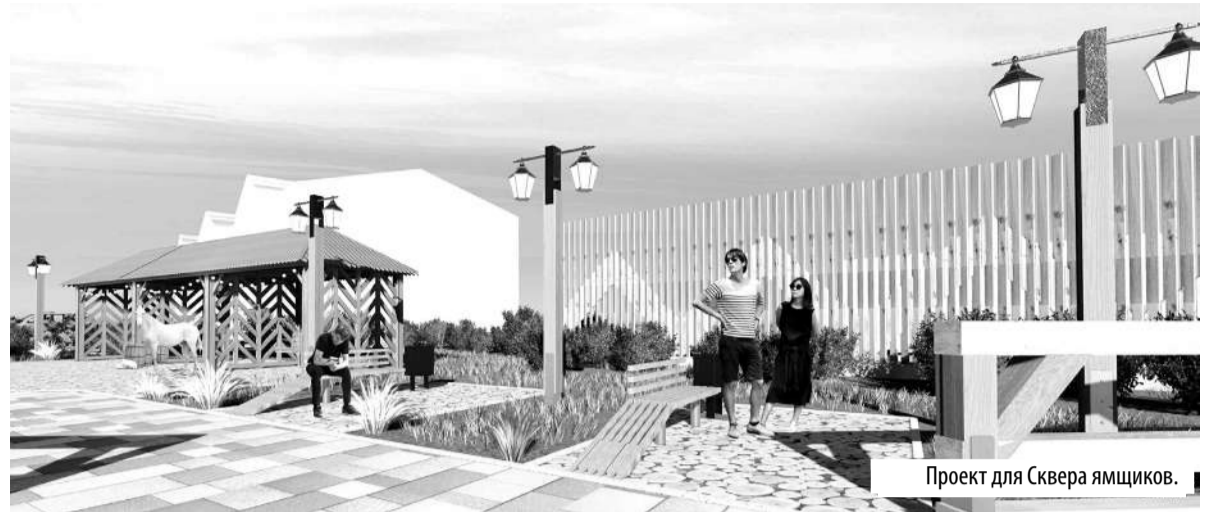
Проект для Сквера ямщиков.

Положительные примеры участия бизнеса в организации открытых пространств: уникальный Ледовый парк в 202-м микрорайоне, который, несмотря на сезонный характер, прекрасно восполняет потребность отдыха на открытом