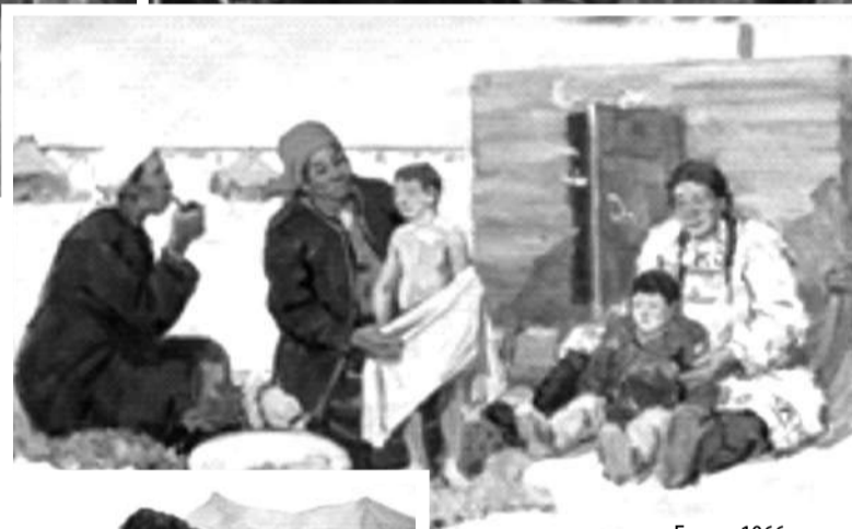
«Баня». 1966 год.