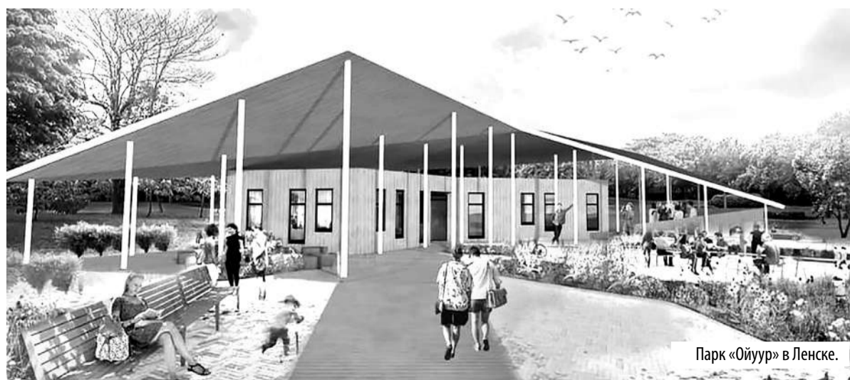
Парк «Ойуур» в Ленске.

После завершения изоляционных мероприятий и выхода из карантина сквер в Бердигестях станет одним из первых объектов, который мы презентуем. Словом, работы много, и все идет по плану.