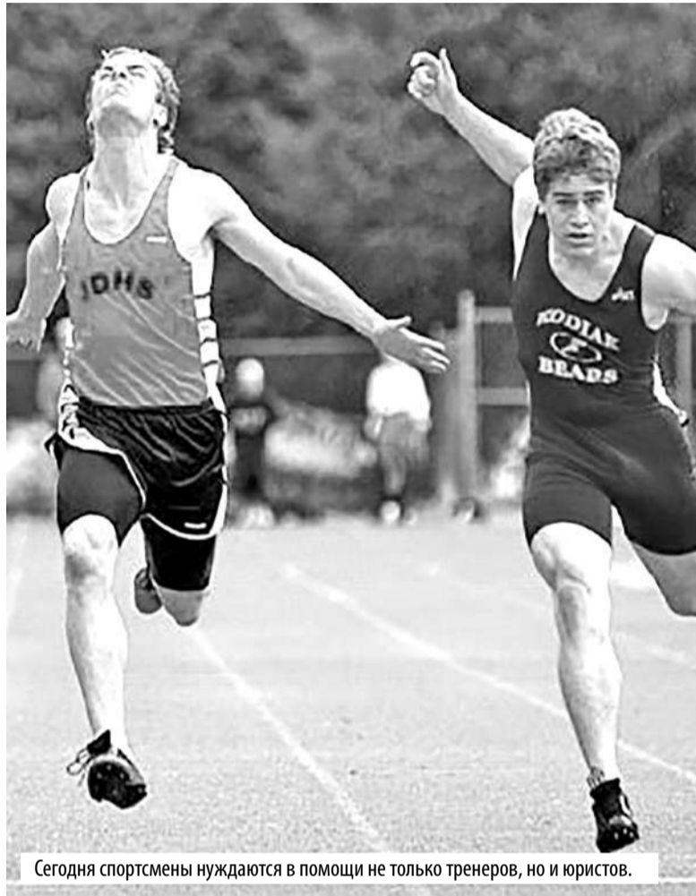
Сегодня спортсмены нуждаются в помощи не только тренеров, но и юристов.

спорта и игр народов Якутии «Сахаада-спорт» начался новый этап развития национальных видов спорта. Благодаря