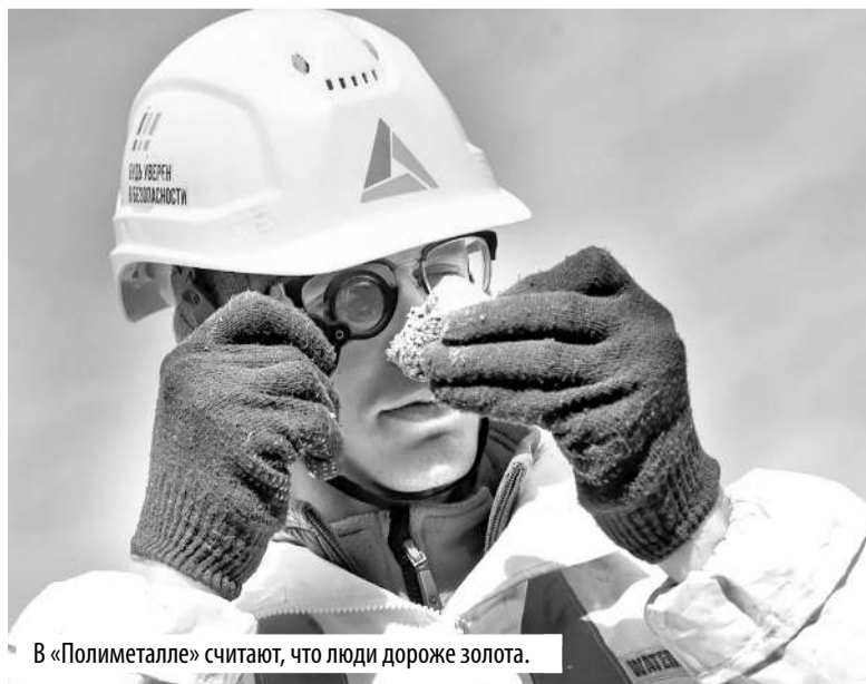
В «Полиметалле» считают, что люди дороже золота.

«Полиметалл» ведет проекты в двух районах Якутии: по освоению Нежданнинского золоторудного месторождения в Томпонском районе и серебряного Прогноза – в Верхоянском. Оба проекта в настоящее время на этапе развития, производство еще не начато. Однако, несмотря на это, компания с момента захода в регион с 2017 года в рамках заключенных договоров о социально-экономическом сотрудничестве оказывает разнообразную помощь в районах присутствия. Приоритет отдается сферам здравоохранения, образования, культуры, дошкольного воспитания и спорта.