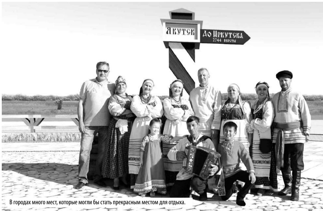
В городах много мест, которые могли бы стать прекрасным местом для отдыха.