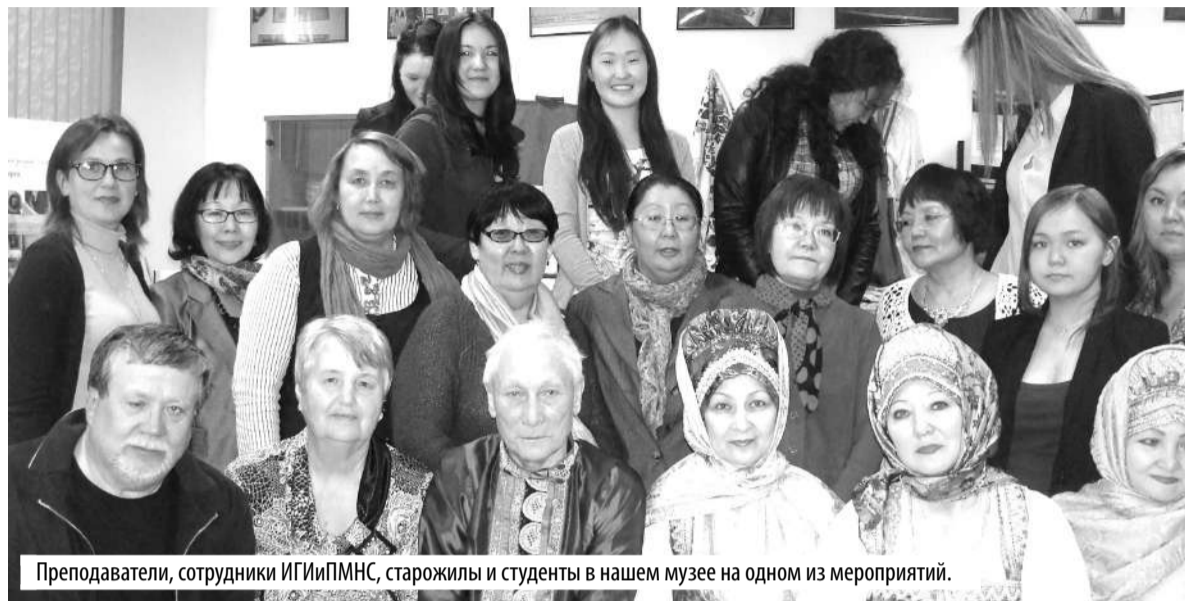
Преподаватели, сотрудники ИГИИПМНС, старожилы и студенты в нашем музее на одном из мероприятий.

Летом 1979 года мне, тогда четверокурснице, выпала удача побывать в одной из этих экспедиций. Почему удача? Потому что на русском отделении было четыре груп-