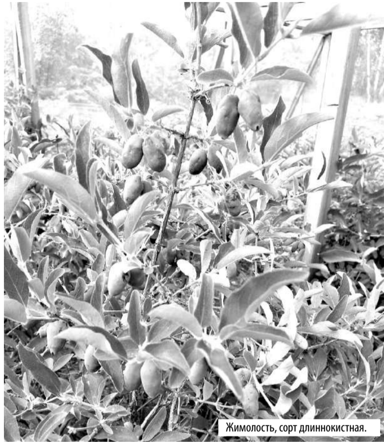
Жимолость, сорт длиннолистная.

Так как жимолость весной рано трогается в рост, посадки лучше делать осенью в ямы глубиной не менее 40 см, диаметром 60 см. Верхний слой почвы смешиваем с ведром перегноя, делаем холмик и устанавливаем на него саженец, расправляем корни. Затем яму заполняем плодородной землей, устраиваем бортики вокруг лунки и наливаем 2-3 ведра