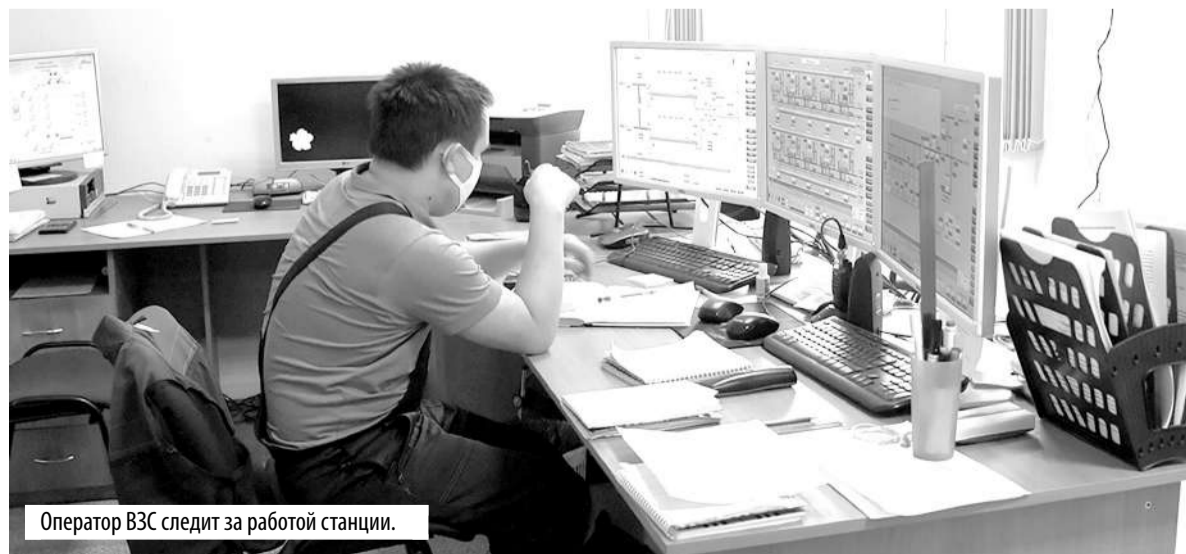
Оператор ВЗС следит за работой станции.

Что касается работы оборудования, то его тестируют на максимальном уровне нагрузки – делается это для того, что-