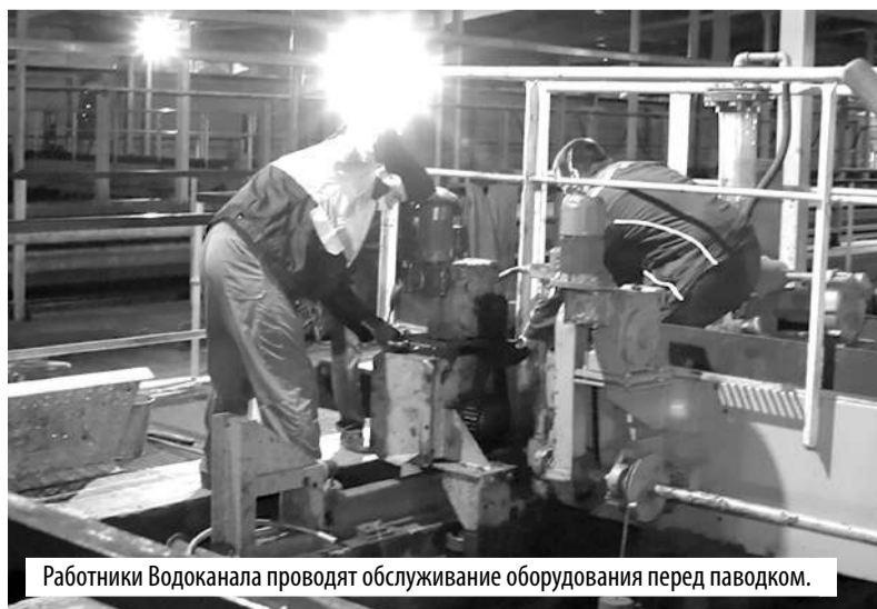
Работники Водоканала проводят обслуживание оборудования перед паводком.