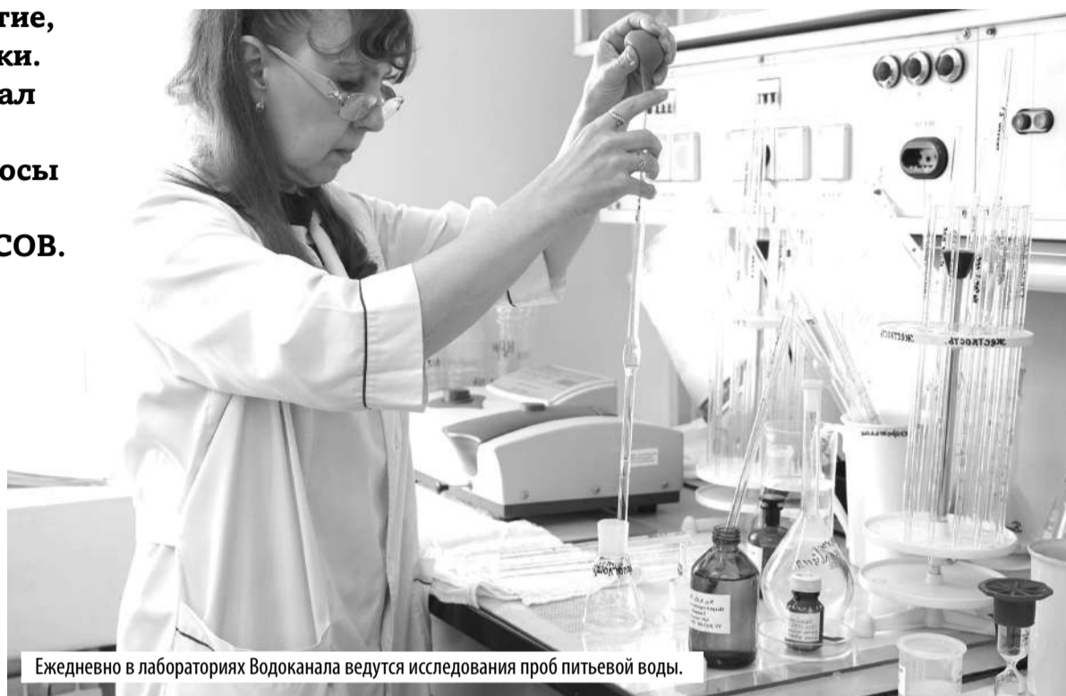
Ежедневно в лабораториях Водоканала ведутся исследования проб питьевой воды.

При этом ремонтная программа продолжает реализовываться.