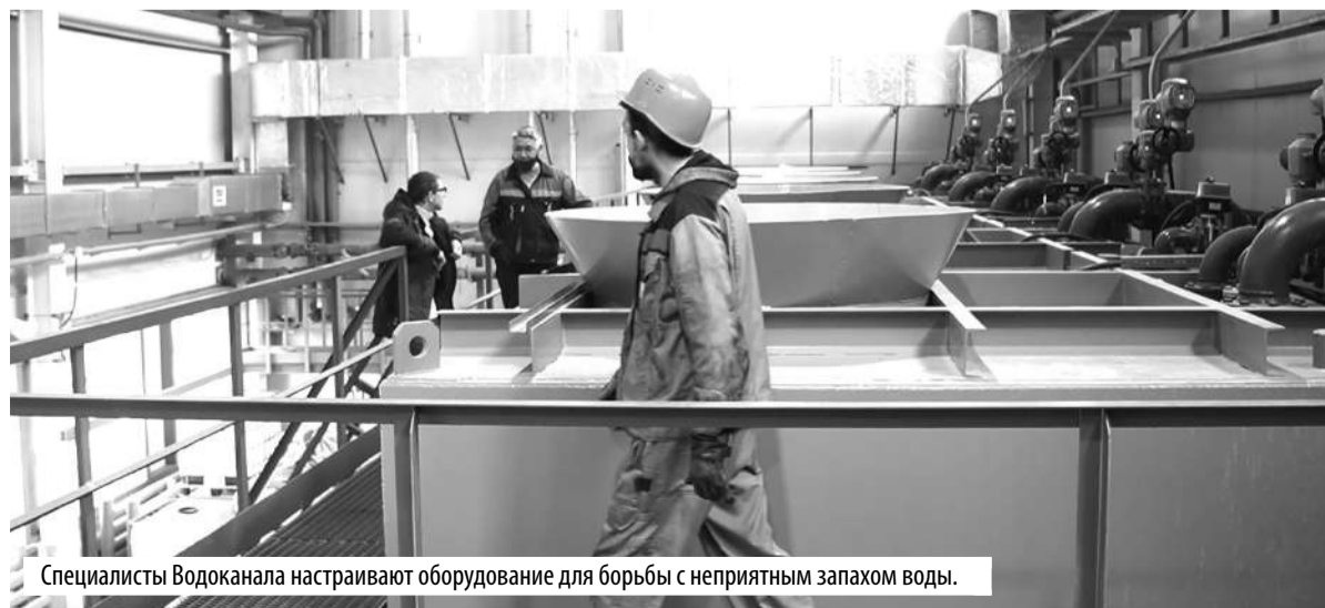
Специалисты Водоканала настраивают оборудование для борьбы с неприятным запахом воды.