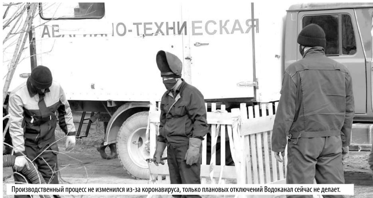
Производственный процесс не изменился из-за коронавируса, только плановых отключений Водоканал сейчас не делает.