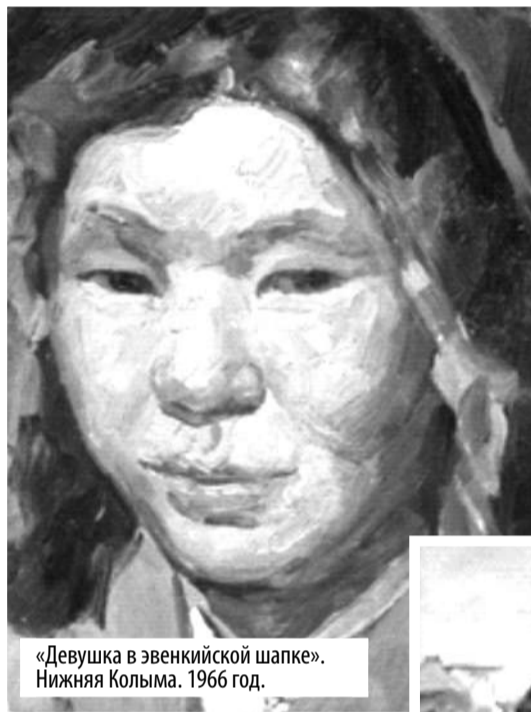
«Девушка в эвенкийской шапке». Нижняя Колыма. 1966 год.

– Работы этого цикла стали пиком, вершиной его творчества.