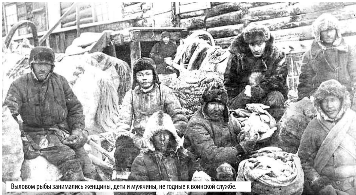
Выловом рыбы занимались женщины, дети и мужчины, не годные к воинской службе.

– Обеспечение рыбпрома орудиями лова, спецодеждой и продукта-