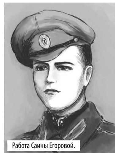
Работа Саины Егоровой.