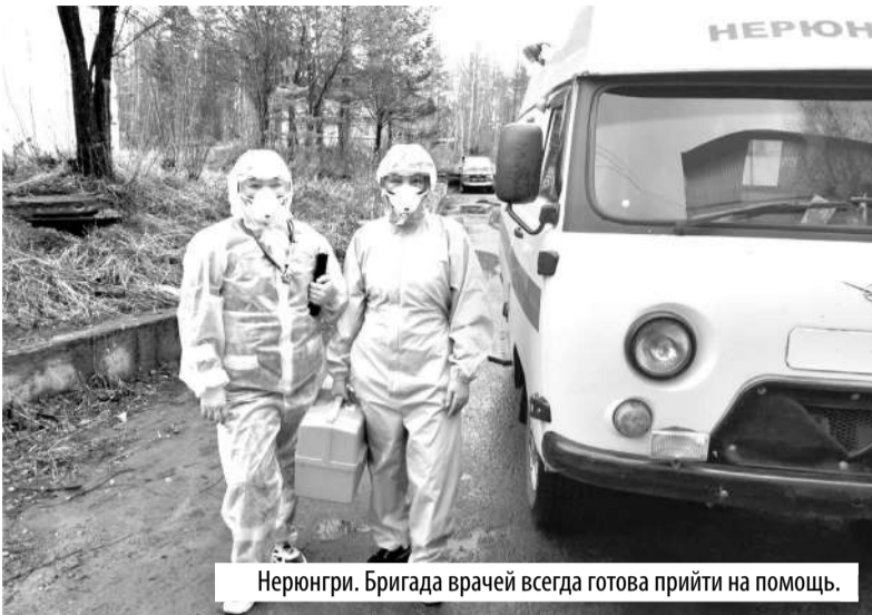
Нерюнгри. Бригада врачей всегда готова прийти на помощь.